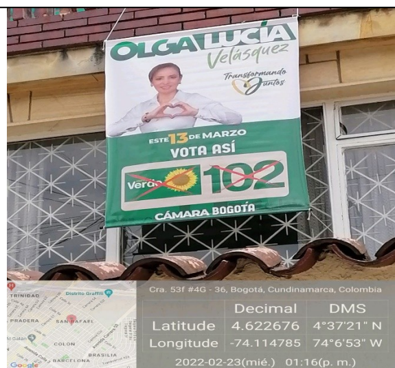
El elemento se encuentra suspendido en antepecho superior al segundo piso.