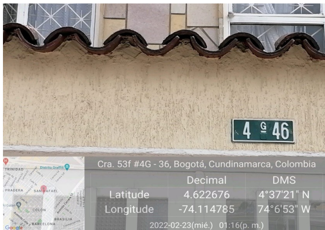
Dirección del inmueble donde se ubica el elemento de publicidad.